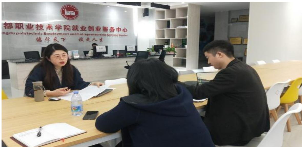
图14 《简笔画》课程团队赴成都职业技术学校交流学习

根据四川省教育厅《关于做好“十四五”职业教育精品在线开放课程建设工作的通知》，学校对标“省级培育职业教育精品在线开放课程标准”对《简笔画》课程进行培育，先后多次前往成都职业技术学院交流，交流课程建设的想法与意见。