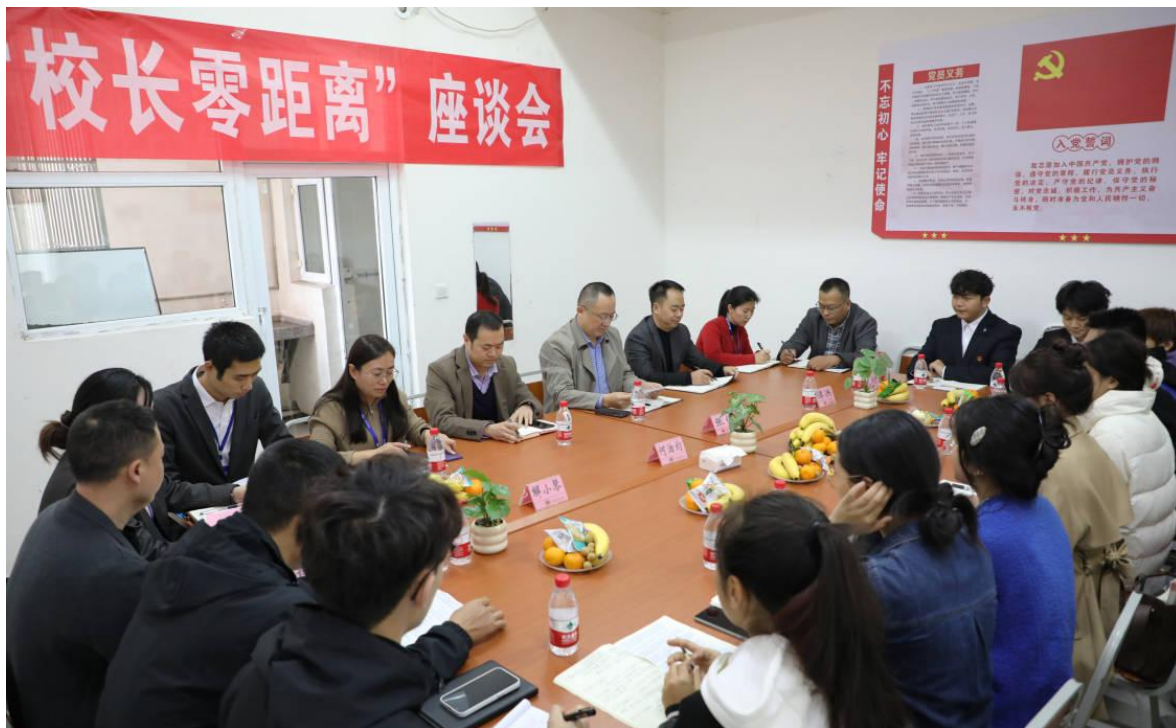
图6 学生社区党团活动一书记校长零距离座谈会

学校按照《教育部思想政治工作司关于开展“一站式”学生社区综合管理模式建设试点工作的通知》要求，投入共计57.4587万元，推进学校“一站式”学生社区建设，按照“能不跑的线上办、必须跑的一处办”的基本原则，建立网上办事大厅、学生事务办理服务中心、心理健康服务站、学生组织联合会办公室、党团活动室、自习室、医务室、学生活动中心等站点，实现教学、学生工作、后勤、心理等的一站式服务，减少学生办事的不便，增强个性化服务能力。自一站式社区建立运行以来线上办理1860项，服务大厅办理9211项，学生会、社团服务6项，心理健康咨询80人，党团活动20场。