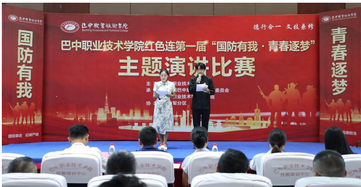
图4 军校联合举办“国防有我，青春逐梦”主题演讲比赛

度，抒发爱国防、强国防、强中华的豪情壮志，彰显了青年学生对建设祖国美好未来的坚定决心和信念。