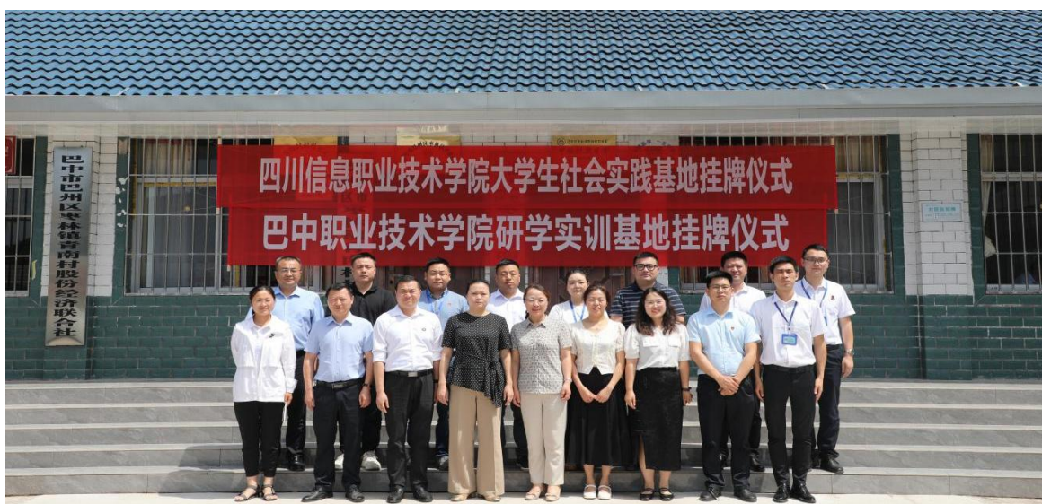
图20 学校与青南村共建研学实训基地