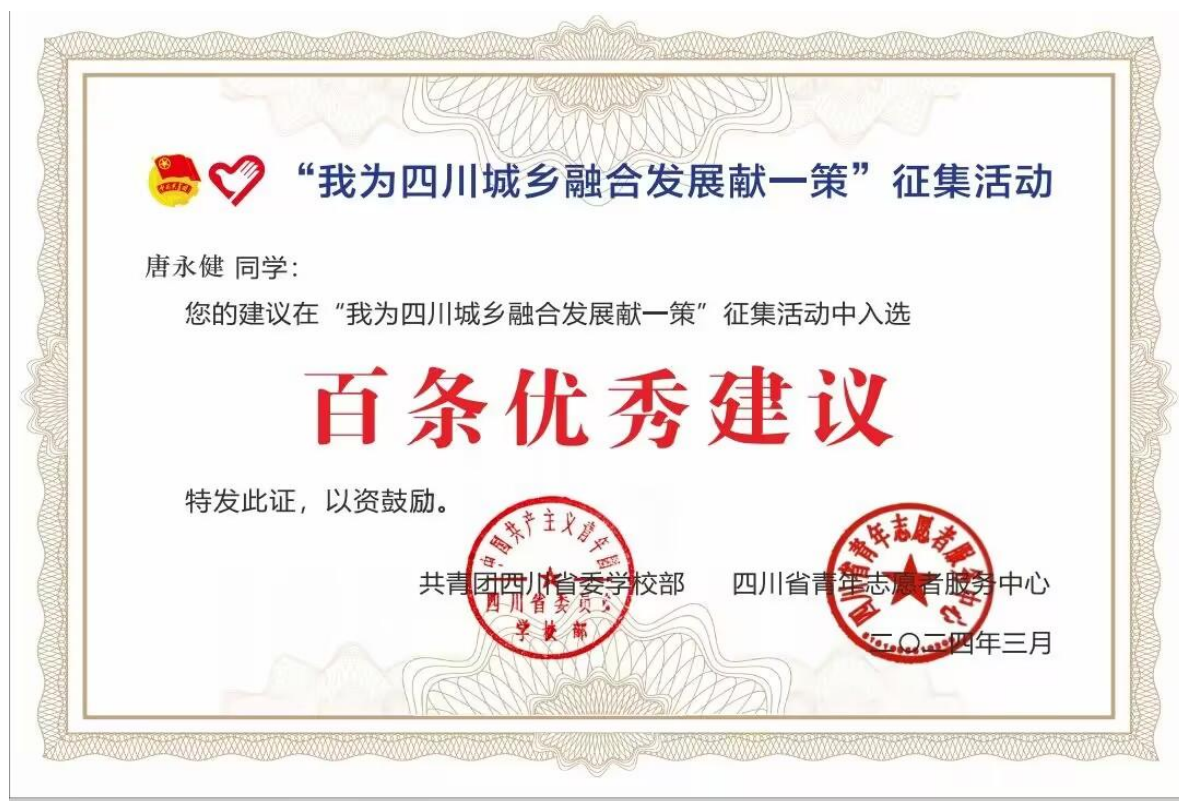
图16 学校学生在城乡融合发展献策列入百条优秀建议

校青年学子积极关注社会热点，勇于提出自己的见解和建议，以共青团实践育人助力城乡融合发展，为奋力谱写中国式现代化四川新篇章贡献自己的力量，为推动社会进步和发展贡献自己的智慧。