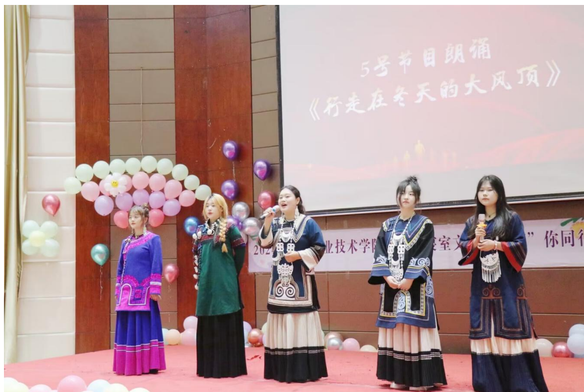
图10 民族学生朗诵《行走在冬天的大风顶》

为充分发挥宿舍育人阵地作用，创造良好的宿舍文化氛围，营造温馨舒适、干净整洁的生活学习环境，培养宿舍成员的凝聚力和团结精神，推动学生寝室文化建设，学校开展第六届寝室文化月活动。活动历时一个多月，围绕“寓你同行·宿说青春”主题开展了“青春征文”“风采寝室评选”“歌唱比赛”“叠被子大赛”“文艺汇演”等主题活动。“文艺汇演”经过选题、排练、筛选等程序，最终展演歌舞、朗诵、情景剧等10个学生文艺作品，充分展现学校美育氛围和学生的审美素养。