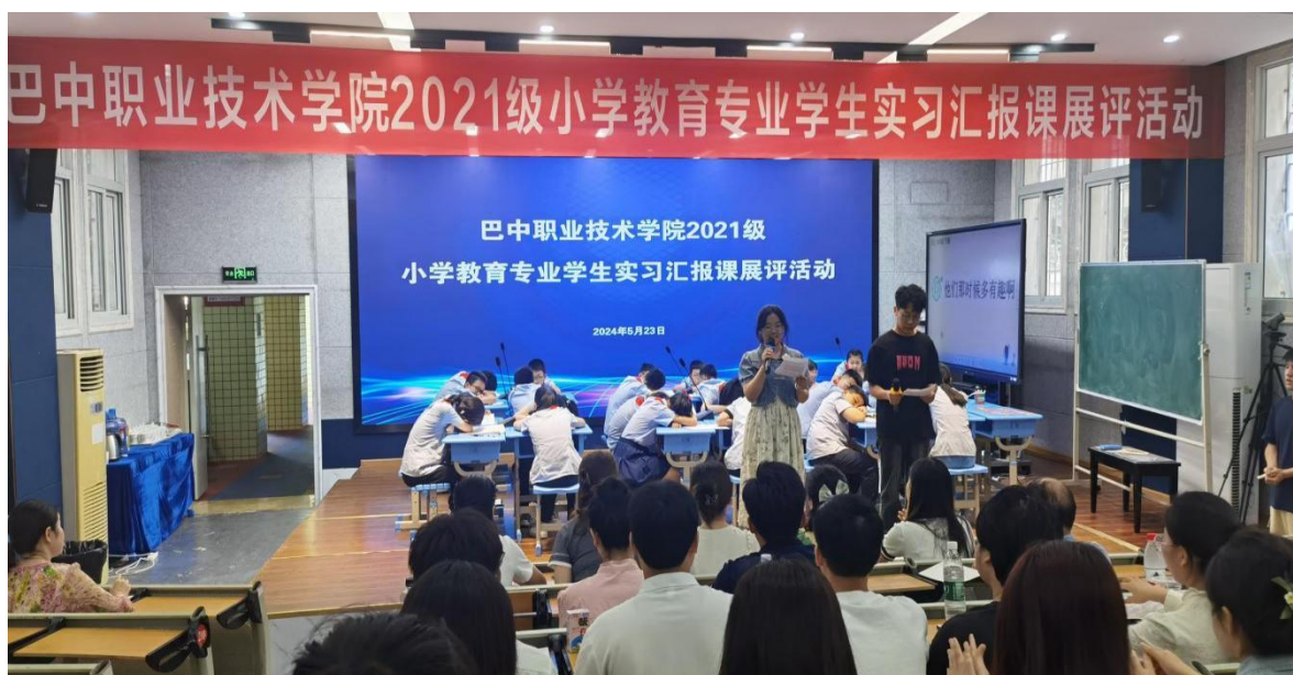
图18 学校小学教育实习汇报展评