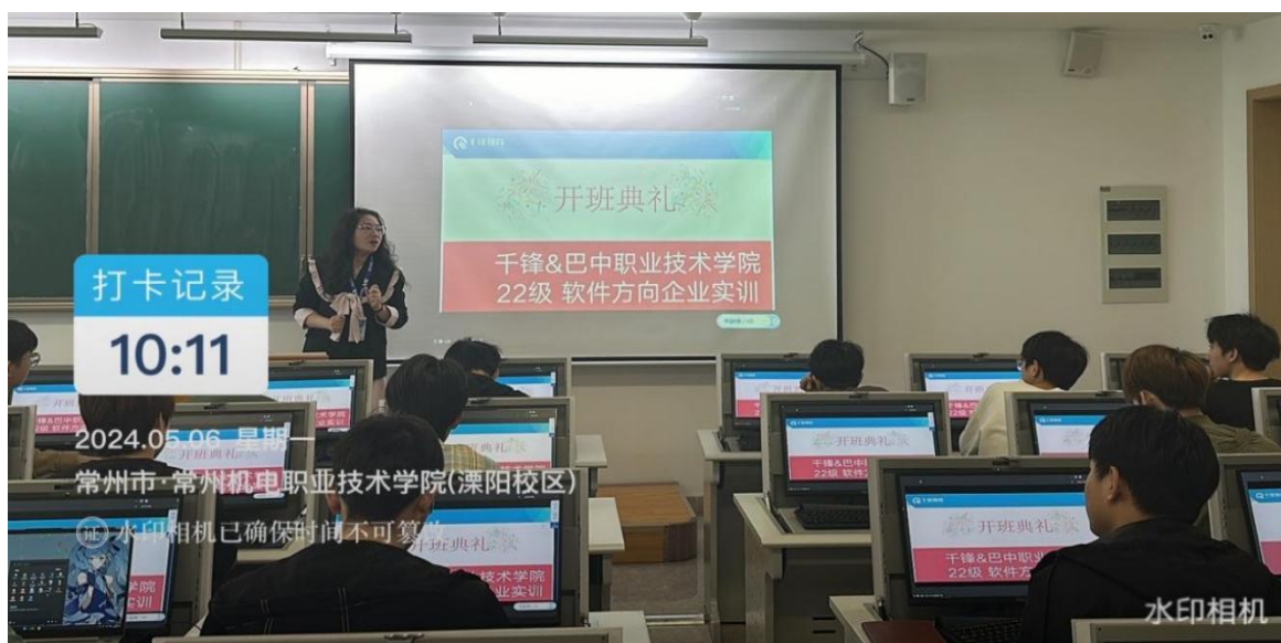
图19 北京千锋科技到校开展项目教学