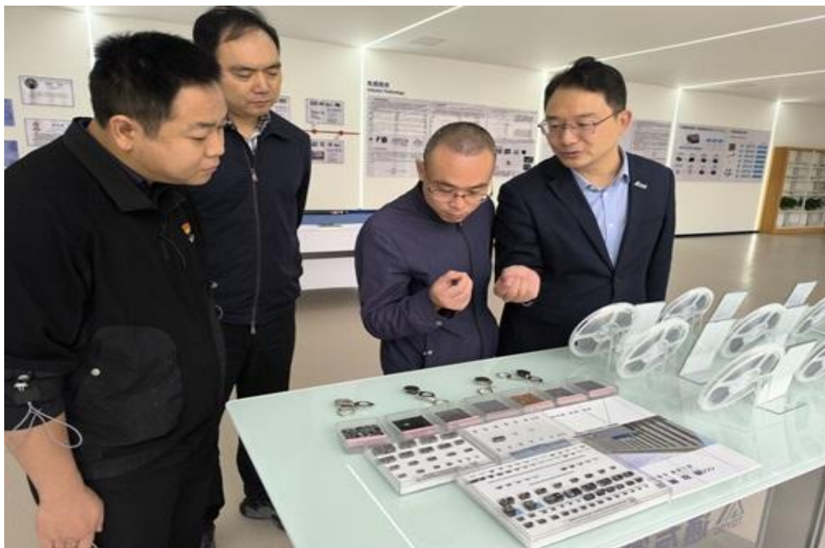
图15 学校教师赴通江企业考察交流

学校教师受通江县经信局邀请，赴通江县对通友微电（四川）有限公司、四川家诚阀门机械有限公司、浙江运达风电通江新能源产业园、四川—艾良方健康药业有限公司、四川芊菇生物科技有限公司等进行考察，就企业的规划、科技项目打造、人才培养方案等方面进行深入交流。在人才需求、项目研发、技术创新应用、校企协同育人等方面开展深度合作，实现互惠共赢。