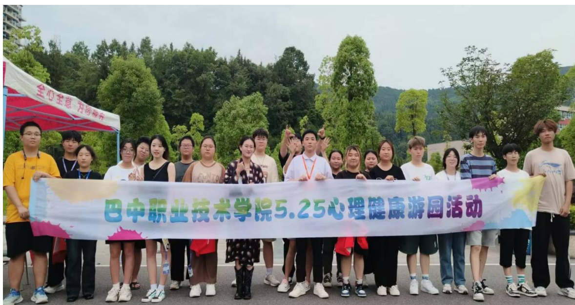
图7 心理健康日游园活动现场

心理健康教育月系列活动在形式上进行大胆创新，融合讲座、比赛、游园日等多种心理健康教育和宣传方式，满足学生个性化需求和兴趣点。这种新颖多样的活动形式不仅增强活动的吸引力，还提升学生参与热情，使他们在轻松氛围中感受到心理健康教育的魅力。