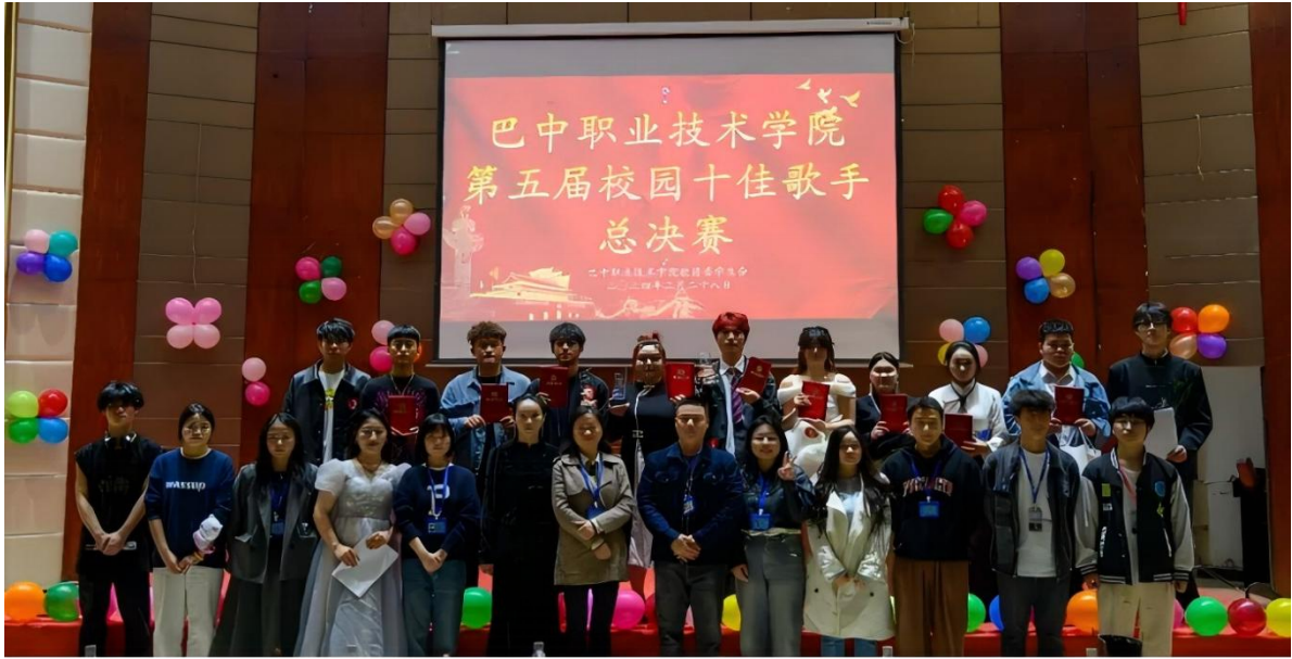
图8 学校第五届校园十佳歌手总决赛现场