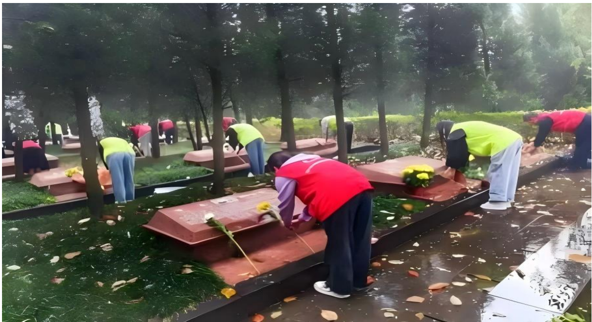
图3 巴中职业技术学院学生向革命先烈敬献鲜花

活动取得了良好的教育效果，覆盖全校各个院系的学生，也激发了团员青年们的爱国热情和奋斗精神，大家纷纷表示要继续弘扬和传承革命先烈们的优良传统，充分弘扬新时代青年的先锋模范作用。