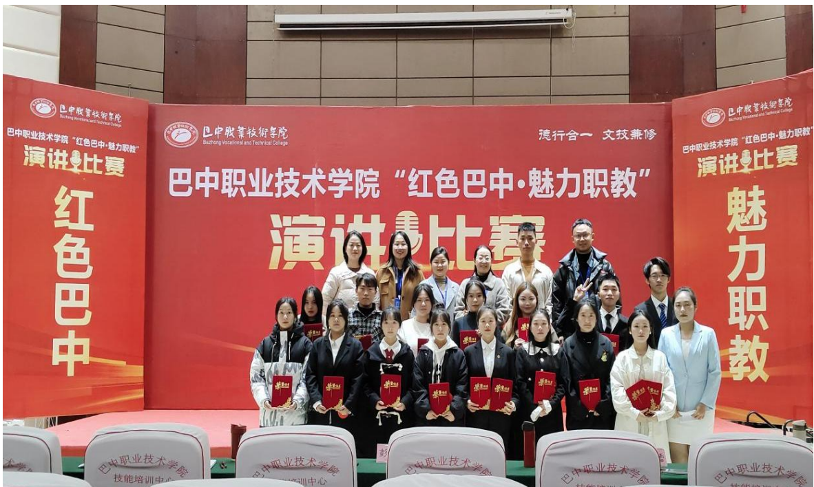
图9 学校演讲比赛决赛现场