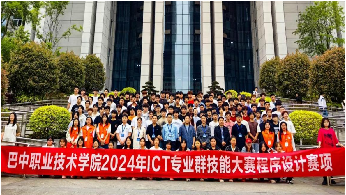
图13 学校ICT专业群程序设计技能大赛